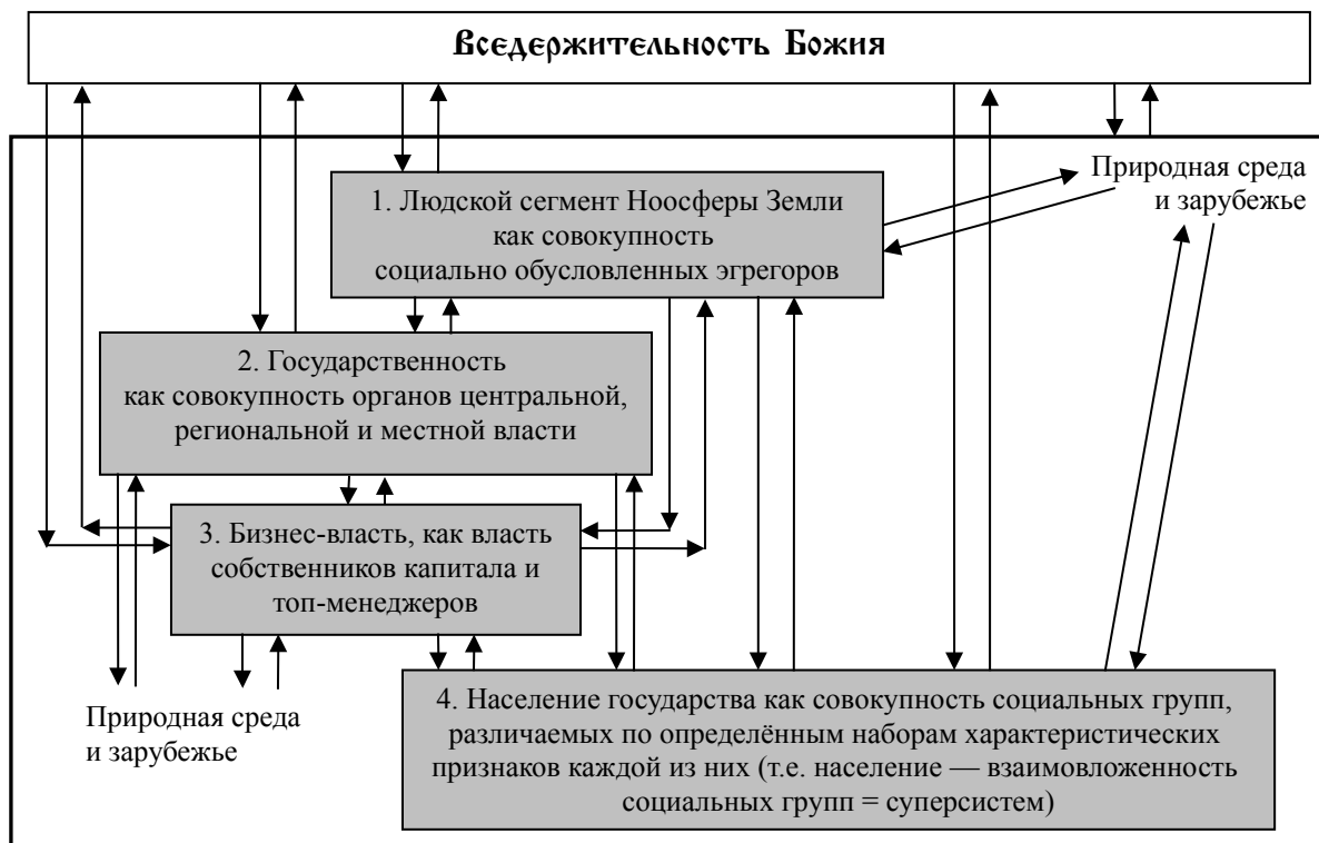
Рис. 1. Схема взаимосвязей частных процессов управления в режиме «автопилота матрично-эгрегорияльного управления»

Аналитическая записка ВП СССР «Правдив и свободен их вещей язык и с Волей Небесною дружен...» была посвящена объективно наличествующим возможностям и процессам, стоящим в объективной реальности за схемой, представленной на рис. 1 1 .